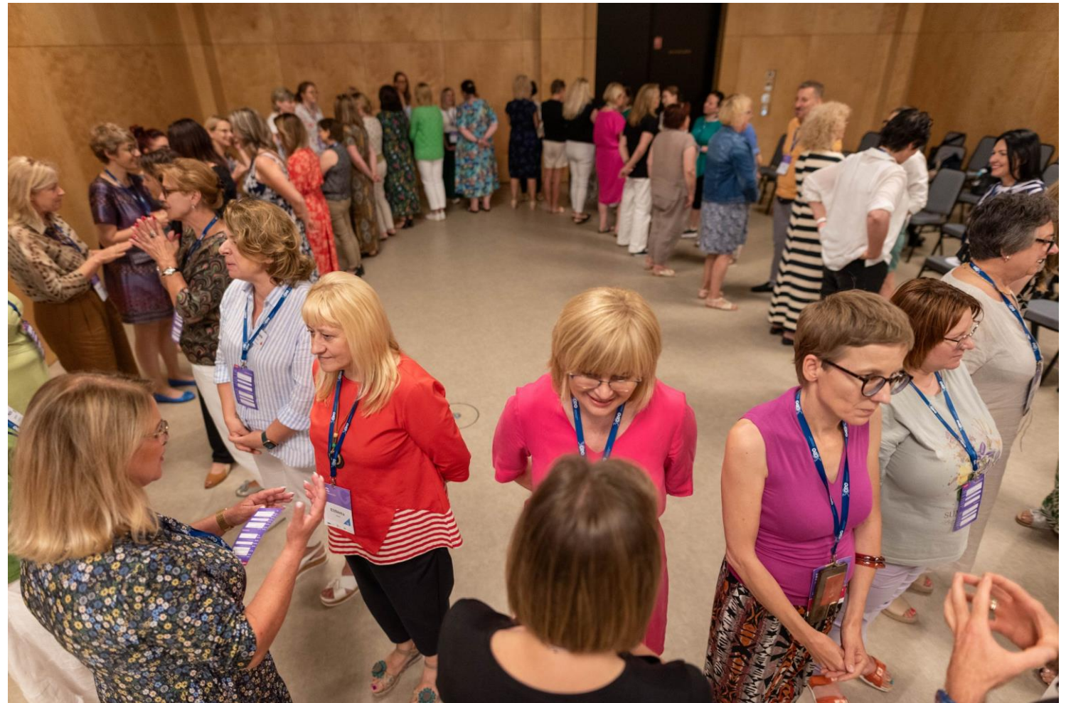
Fot. Kamil Mąkosza, Centrum Edukacji Obywatelskiej, Letnia Szkoła Dyrektorów 2024