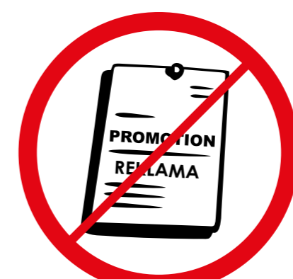
Przedmioty, materiały, ubrania komercyjne i promocyjne