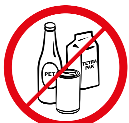
Butełki, puszki, kubki, dzbanki