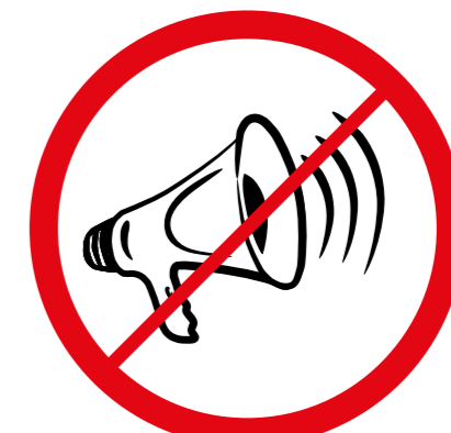
Megafony, syreny, inne urządzenia emitujące dźwięk