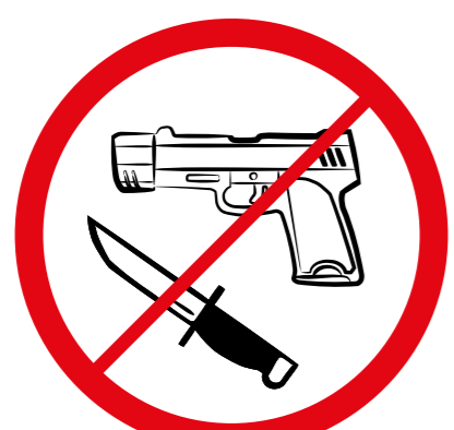
Broń, materiały wybuchowe, noże