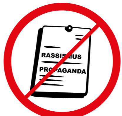
Materiały rasistowskie, ksenofobiczne, polityczne, religijne, propagandowe