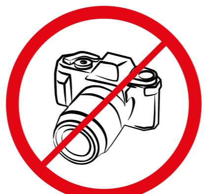
Profesjonalne aparaty fotograficzne, kamery wideo