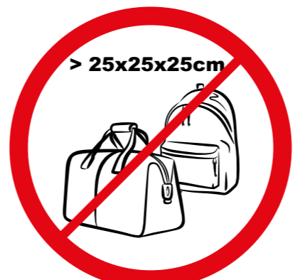
Pudła, torby, plecaki, walizki i inne wszelkie przedmioty większe niż 25 cm x 25 cm x 25 cm