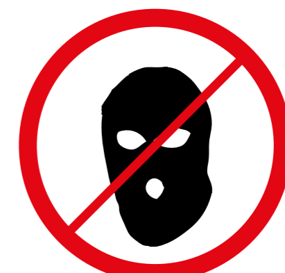
Części ubioru zakrywające twarz, kominiarki