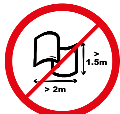
Banery lub flagi o wymiarach większych niż 2.0 m x 1.5 m.