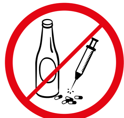
Napoje alkoholowe, narkotyki