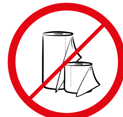
Duże ilości papieru