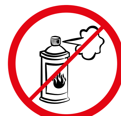
Gas w aerozolu, substancje żrące, łatwopalne, barwniki